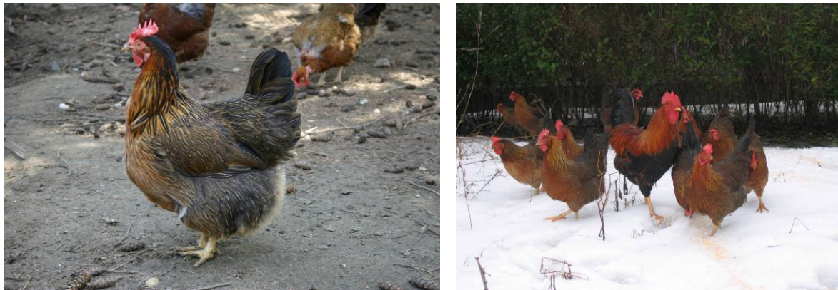
Fogolyszínű magyar tyúk (Gödöllő, 2005)

A tojó alapszíne az egész testre kiterjedően barna, hasonlít a fogoly színéhez. Finom rajzú tollazata a mellen vöröses, a nyakon, vállon és háton (a nyeregtollakon) sárgás, a test hátsó részén és a hason szürkés árnyalatú. A fark és a szárny evezőtollai feketék vagy sötétbarnák. A nyaktollakon fekete, keskeny csíkok láthatók, úgyszintén a mell-, hát- és szárnytollakon is keskeny, barna sávokból álló a toll körvonalához hasonló rajz található (rajzolt toll). A kakas nyak- és nyeregtollazata arany-sárga, piros árnyalattal. A nyak- és nyeregtollak hosszában vékony, fekete csík látható. A fej tollazata narancsvörös, a nyereg, a váll és a hát felső része barnáspiros, a mell, a has és a combok fedőtollai pedig feketék. A kakas sarlófaroktollai szintén feketék, zölden zománcolt árnyalattal. Csibéik pelyhezete közép-barna, világosabb tarkázottsággal élénkített, vadmadárszerű színeződésű. Tojásaik színe a többi magyar tyúkfajtaéhoz hasonlóan világosbarna vagy barna.